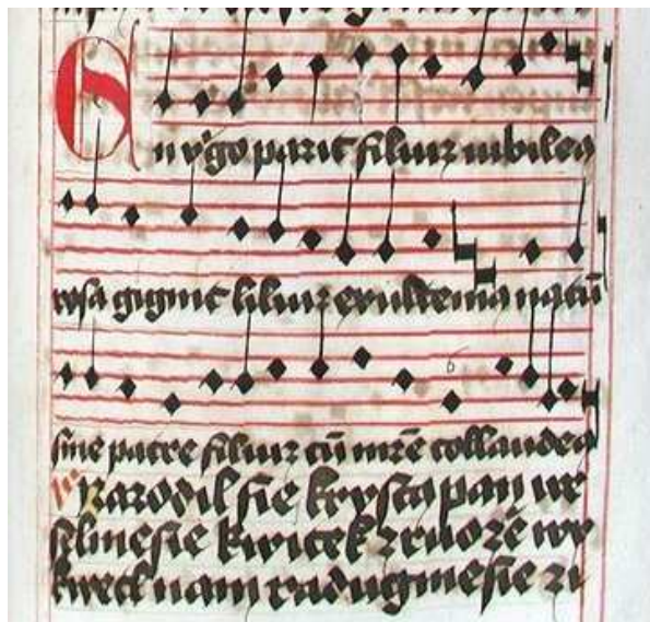
En virgo parit filium – Narodil se Kristus Pán

Jenž prorokován jest, veselme se, ten na svět poslán jest, radujme se! Z života čistého, z rodu královského, nám, nám narodil se.